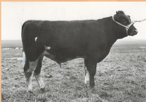
Jet Gelf 661R Fokker J. Jongbloed Britswerd