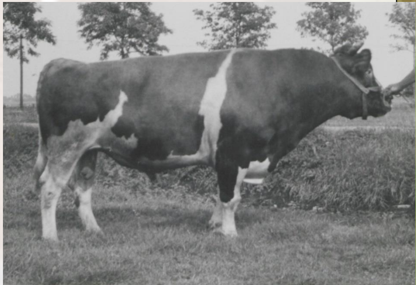
Maurits 309 R-FRS, de enige roodbonte Friese preferentschapskandidaat ooit